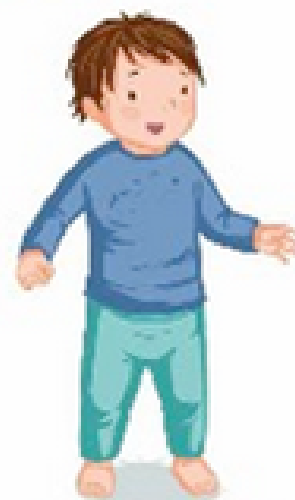
SE TENIR DEBOUT

RIEN NE SERT DE BRÛLER LES ÉTAPES : C'EST EN LAISSANT L'ENFANT LES FRANCHIR, À SON RYTHME, QU'IL PROGRESSERA.