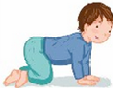
SE METTRE À 4 PATTES