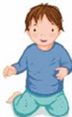
SE METTRE À GENOUX