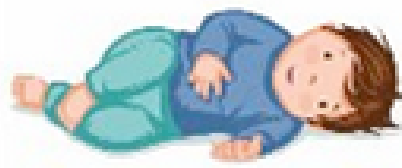
SE METTRE SUR LE CÔTÉ