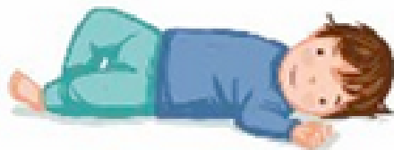
S'ALLONGER AU SOL